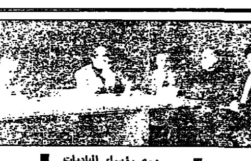
مع رؤساء البلديات